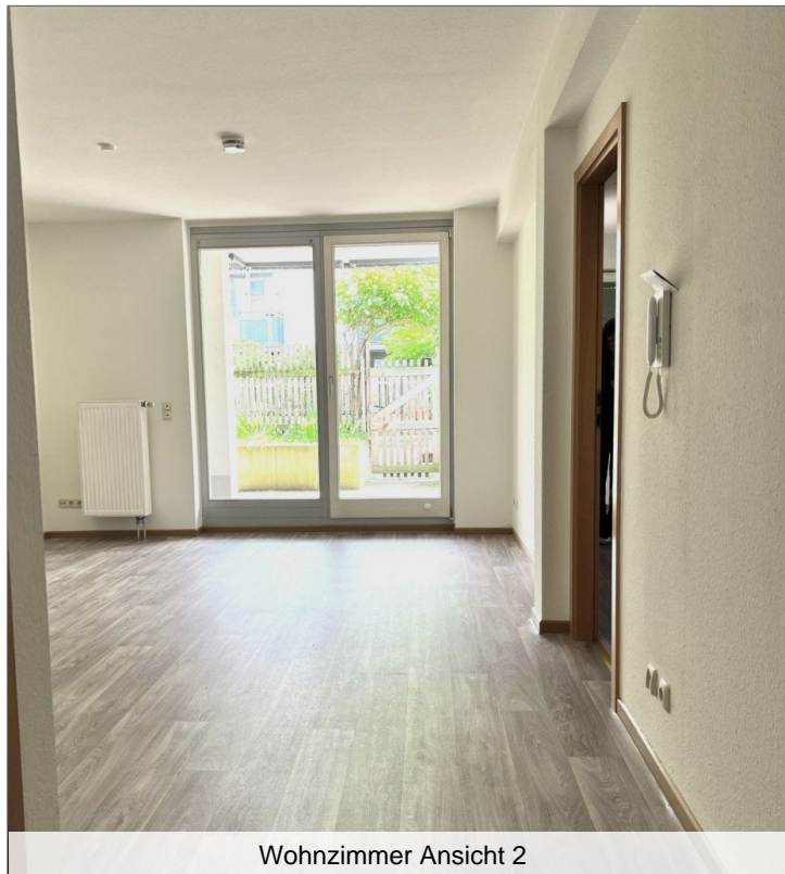
Wohnzimmer Ansicht 2